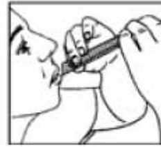
Llevar a la boca presionar y extraer

Si los síntomas empeoran o persisten después de 7 días debe consultar a su médico.