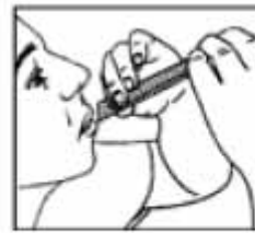
Llevar a la boca presionar y extraer

Si los síntomas empeoran o persisten después de 7 días debe consultar a su médico.